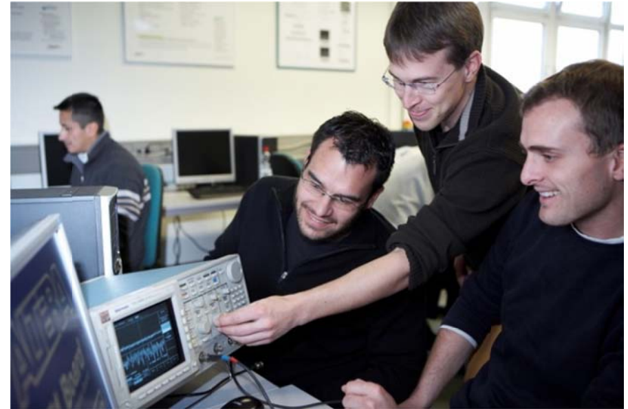
Präsenzlehre an der Hochschule Darmstadt