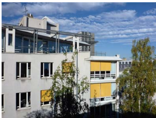
Gebäude des Fachbereichs Elektrotechnik und Informationstechnik der Hochschule Darmstadt

Informieren Sie sich im Modulhandbuch unseres Fernmasterstudiengangs Elektrotechnik unter www.fernstudium-elektrotechnik.de/weitere-infos/downloads über unser fachliches Angebot.